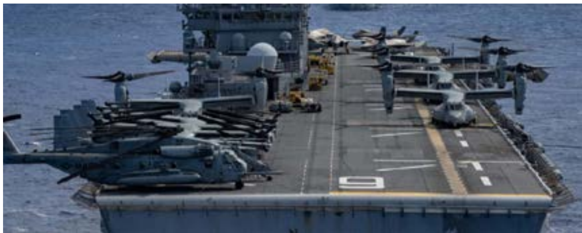
El proceso duraría varios meses y que el plan prevé operaciones en espacio aéreo y aguas internacionales, pero uno de los funcionarios consultados dijo que el despliegue es una demostración de fuerza.

Estados Unidos ha desplegado 4.000 militares en aguas de América Latina y el Caribe.