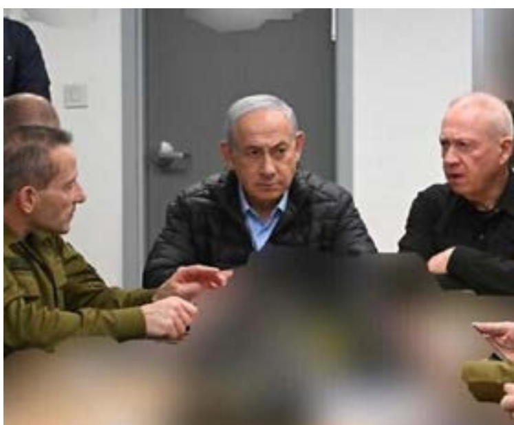
Israel examina respuesta de Hamás a propuesta de tregua

A pesar de los avances, la situación sigue siendo extremadamente frágil. La principal brecha entre ambas partes persiste: mientras que Hamás busca un alto el fuego permanente y la retirada total de las tropas, Israel se enfoca en la liberación de todos los rehenes y la erradicación de Hamás como fuerza militar y política en la región. Analistas coinciden en que, aunque la aceptación de Hamás es una señal positiva, las negociaciones serán prolongadas y su éxito aún no está garantizado.