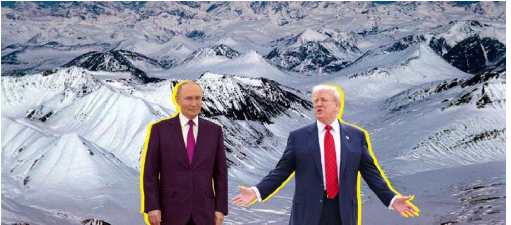
Donald Trump encabezó una cumbre con el mandatario ruso Vladímir Putin en Anchorage, Alaska