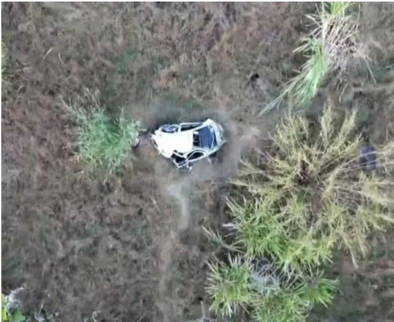
Una pareja perdió la vida en un trágico accidente que ha conmocionado a la región de San Pablo, Brasil. Sus cuerpos sin vida fueron hallados al fondo de un precipicio de 400 metros, dentro de un vehículo que se precipitó desde un mirador turístico.

El hallazgo, dramático, se produjo a la mañana siguiente. Un trabajador