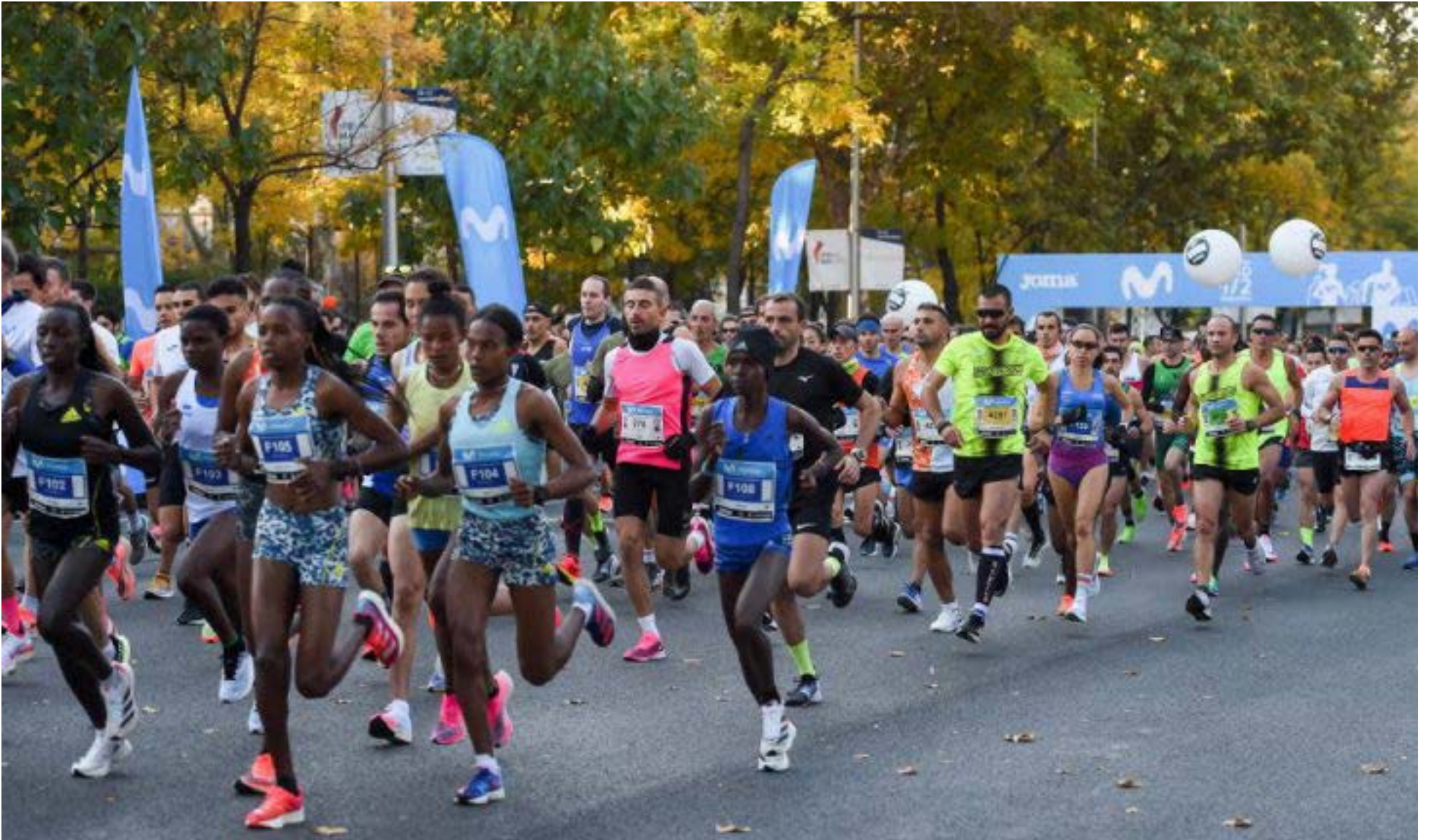
Media Maratón Andina CCB de Fusagasugá, Cundinamarca

F usagasugá, Cundinamarca, se prepara para ser la sede de la Media Maratón Andina CCB el próximo 30 de noviembre. Este evento deportivo, impulsado por la Cámara de Comercio de Bogotá (CCB), busca no solo promover el deporte, sino también reactivar la economía y el turismo en la provincia del Sumapaz. Impulso económico y social