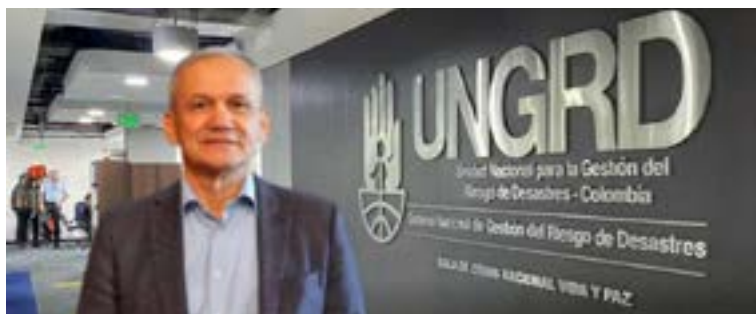
Carlos Ramón González se encuentra en Nicaragua. El gobierno del presidente Gustavo Petro ha solicitado a ese país su regreso a Colombia para que enfrente un proceso judicial por presuntas irregularidades en la contratación.

En los círculos políticos se señala que Carlos Ramón González, considerado el líder del Partido Alianza Verde, jugó un papel decisivo en el respaldo a entonces excandidata a la alcaldía de Bogotá, Claudia López, lo que, según se comenta, le habría permitido a su partido obtener contratos de envergadura.