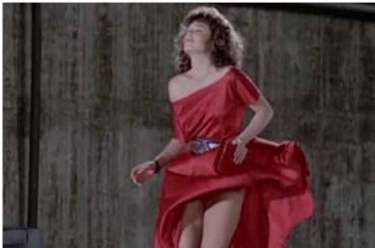
Una chica de tez pálida y cabellos negros encrespados; los lucía cortos. Tenía unos ojos negros, enormes, que hacían juego con el color de su pelo negro retinto. Venía con un vestido rojo

tial. Se sentó a mi lado sin titubeos, lanzándome una pícaro mirada. La destacaban sus piernas largas y delgadas, escondidas bajo unas medias de nylon color marrón claro. Se mostraba extrovertida, amable e inteligente. Y graciosa. Adoraba escribir y leer como el resto de la gente nueva y distinta que, en ese centro de enseñanza, me rodeaba dos veces por semana. Simpatizamos como dos imanes.