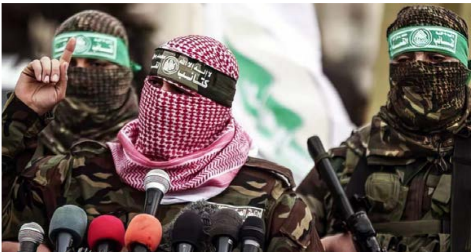
Hamás acepta la propuesta de tregua de los mediadores Qatar y Egipto para frenar las hostilidades en Gaza