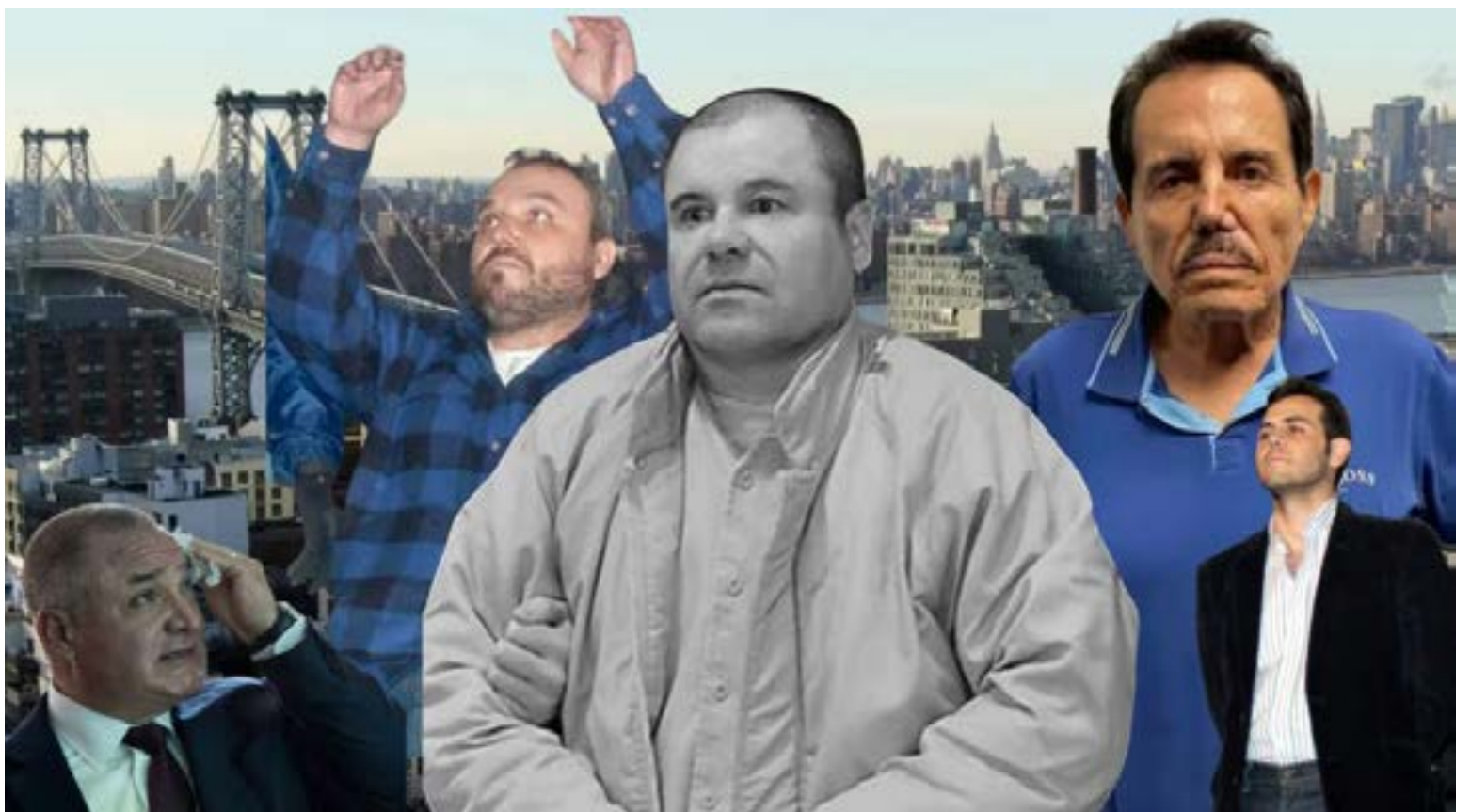
Desde «El Chapo» hasta «El Mayo». Nueva York se ha vuelto el «confesionario» de los narcos mexicanos.

El acuerdo de culpabilidad de Zambada, un movimiento sorpresivo que se hizo posible después de que la Fiscalía de EE. UU. decidiera no buscar la pena de muerte en su contra, podría profundizar aún más las divisiones y reconfigurar el mapa criminal en México, abriendo la puerta a nuevas alianzas y conflictos.