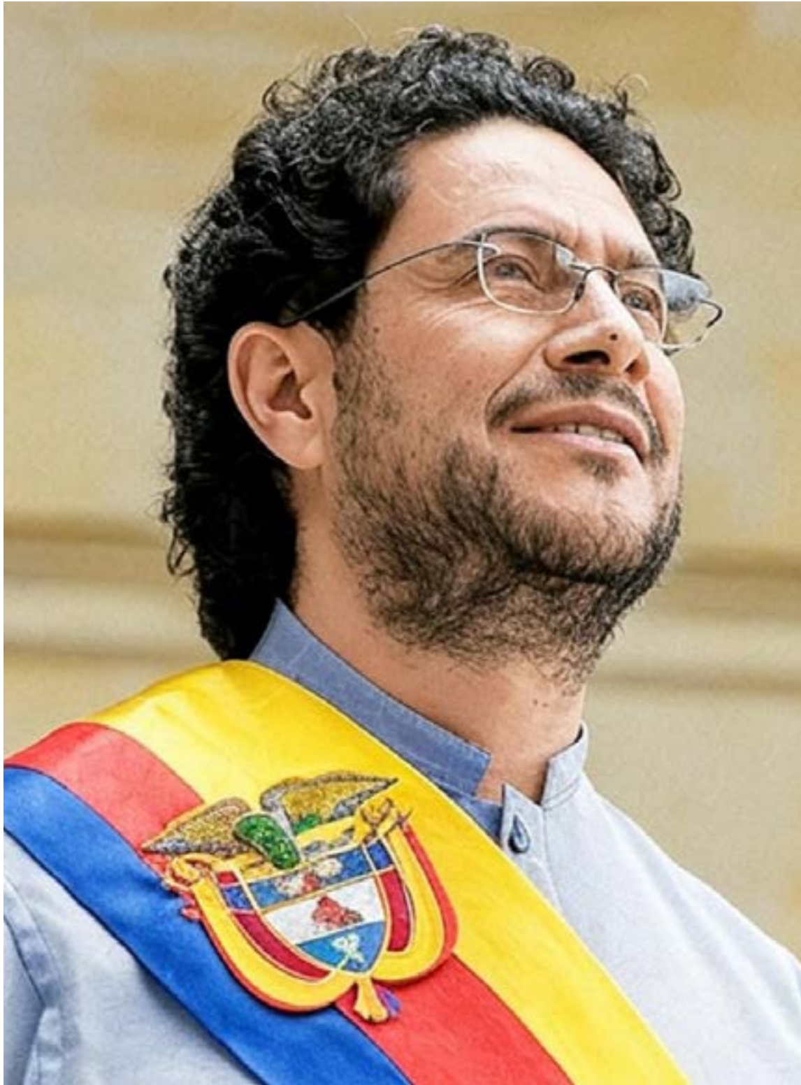
Iván Cepeda Castro, viene siendo impulsado para asumir como precandidato a la Presidencia de Colombia.

Ante esta solicitud, el senador Iván Cepeda respondió públicamente, mostrando su profundo respeto y consideración por el llamado. En su mensaje, el congresista reconoció la importancia de la voz de las víctimas y afirmó que la tendría en cuenta al momento de tomar una decisión definitiva. Este intercambio, que pasó de las redes sociales a la esfera política, resalta el papel de las víctimas en la configuración de los liderazgos y la política en Colombia. La respuesta de Cepeda ha sido interpretada por muchos como una puerta abierta a la posibilidad de una candidatura oficial. El apoyo a la precandidatura de Cepeda no tardó