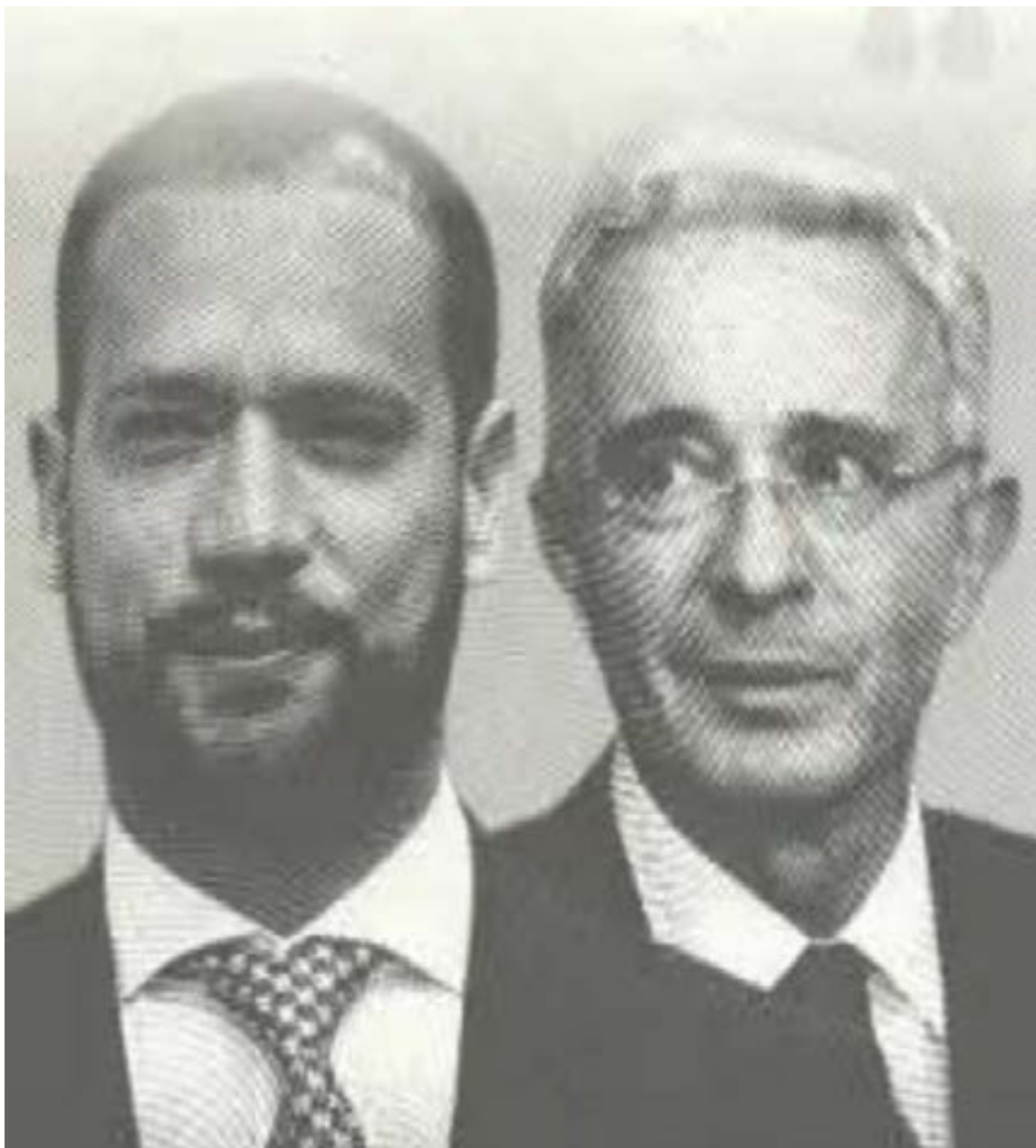
El caso del expresidente Álvaro Uribe Vélez y su abogado Diego Cadena, ambos condenados durante los respectivos juicios

En el centro de esta trama apareció el abogado Diego Cadena. La Corte Suprema detectó que Cadena, actuando como defensor de Uribe, visitó varias cárceles del país y se reunió con ex paramilitares y narcotraficantes. La Fiscalía lo ha señalado de haber ofrecido be-